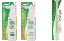
薬用口腔保湿ミスト 舌ブラシ