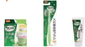
入れ歯ポット 入れ歯 洗浄ブラシ 入れ歯の 歯みがき