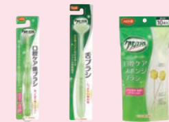
歯ブラシ 舌ブラシ スポンジ ブラシ

食べかすや痰の乾いた ものが溜まりやすいの で、歯、粘膜、舌もやさ しくみがきます。