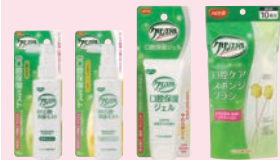
薬用口腔 保湿ミスト 保湿ジェル スポンジ ブラシ

歯ぐきをマッサージし ながら、お口全体を保 湿します。 乾燥しがちなお口に潤 いを与えます。