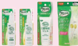
薬用口腔 保湿ミスト 保湿ジェル スポンジ ブラシ