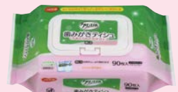
歯みがきティッシュ