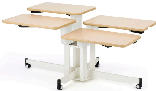
個別昇降テーブル