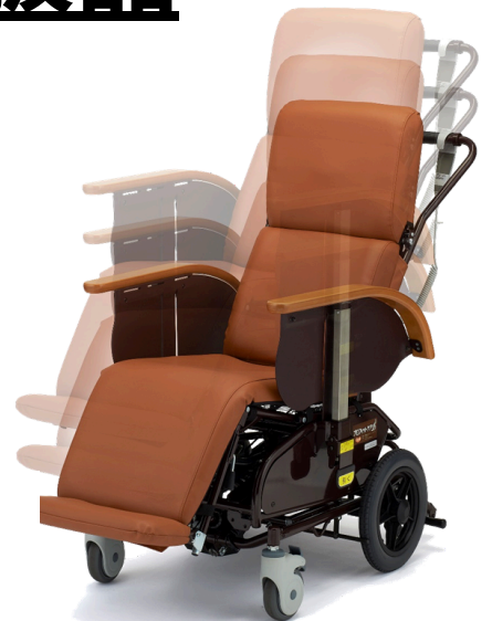
電動昇降リクライニング