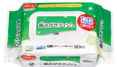
歯みがきティッシュ

この他にも商品展示を行います 実際に手にとってお試しいただけますので ご来場の際はぜひお立ち寄りください