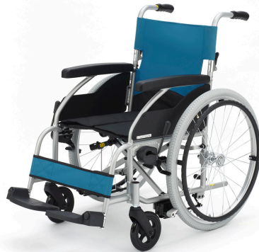
自動ブレーキ付車いす